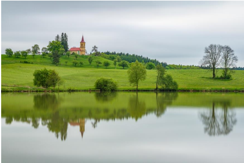
2. Místo Jiří Svoboda – Les Království