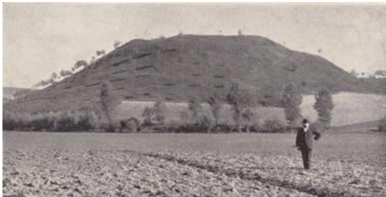
Kopec, kde stál vřešťovský hrad, z konce 19. století