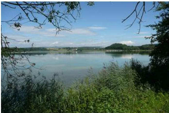
Pohled na Velkovřešťovský rybník

K dispozici je mapka, která vám bude užitečným vodítkem. Dostanete ji v prodejnách autokempu.